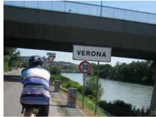
Een vriendelijke oudere man fietste een heel eind met ons mee om ons de weg te wijzen.