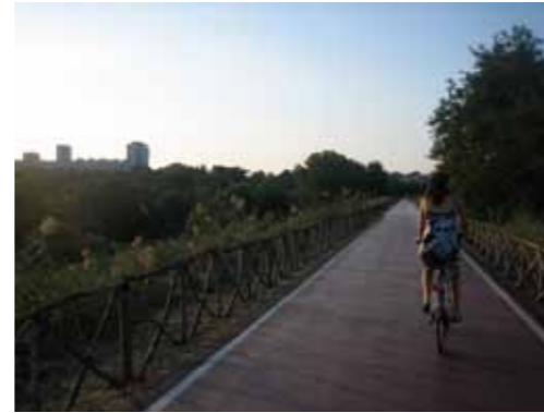
Fietspad langs de Tiber naar Rome

Alle lof voor Hans Reitsma, het is een geweldige route, de hele 2100 kilometer. Zelfs het laatste tochtje tot aan het Vaticaan loopt nog over een fietspad door de weilanden langs de Tiber, en in de stad langs boulevards en parken. We hebben een paar keer Rome bezocht, wat best gek is op de fiets - vooral op je eigen fiets - omdat je overal zoveel sneller komt dan te voet. Dus zie je veel. Het Vaticaan is van een uitzinnige weelde, een bijna absurde rijkdom. Wat een contrast met de landweggetjes, ik had daar al heimwee naar.