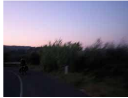
De vroege ochtenden waren het mooist