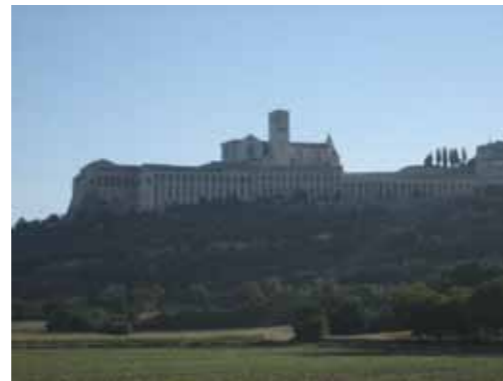
Assisi met de kerken voor Franciscus