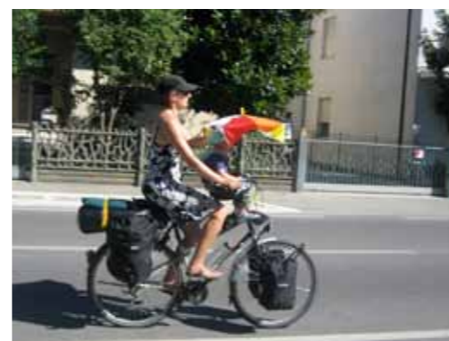
Wel een beetje embarrassing met die paraplu, ik voelde me net een ijscowagen