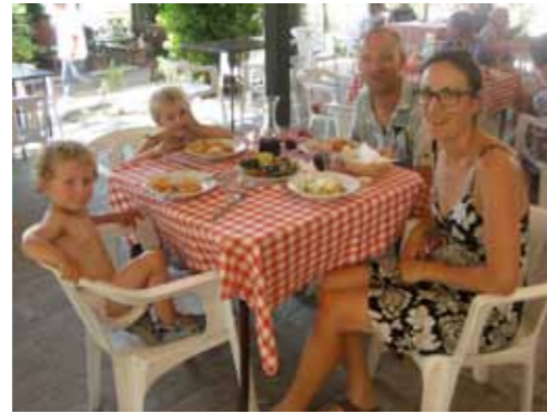
Lekker lunchen in het restaurant van de camping