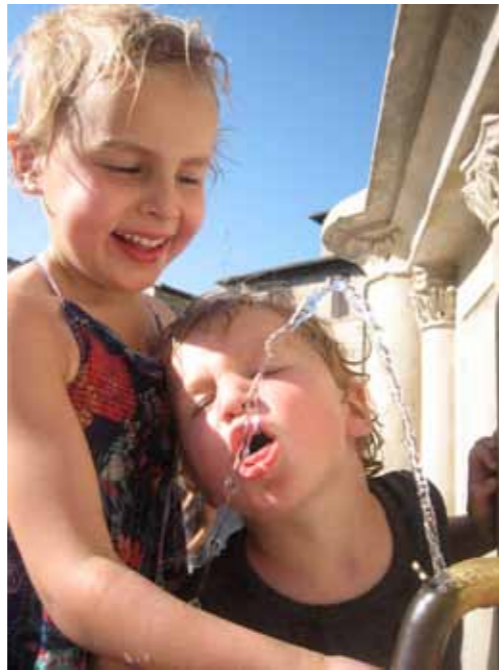
Afkoelen aan de fontein in Bevagna