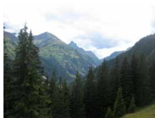
Een ongerept dal bij de afdaling