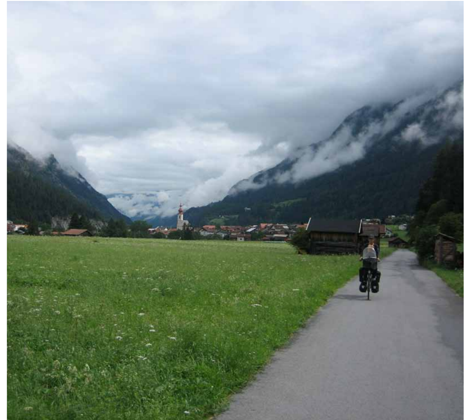
Rechts: Een lichte etappe tussen twee zware in, de dag dat ik definitief om was voor het fietsen