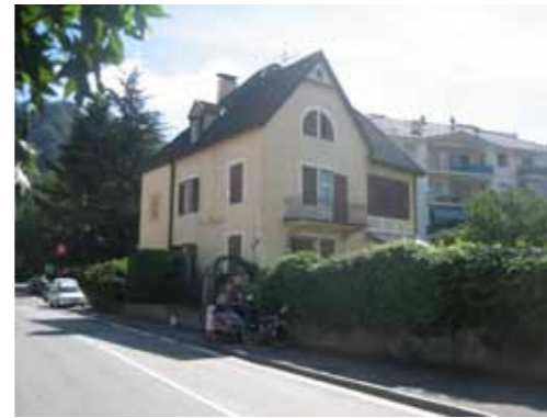
Kathrins huis in Bolzano