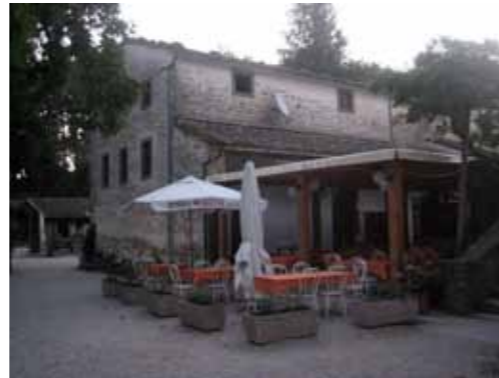
Agriturismo Ca' di Gianni