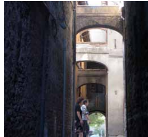
Rechts: Uitzicht over Assisi vanaf het muurtje waar we pizza aten