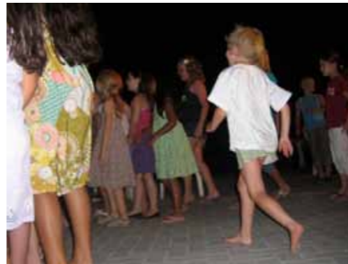
'Entertainment' op de camping