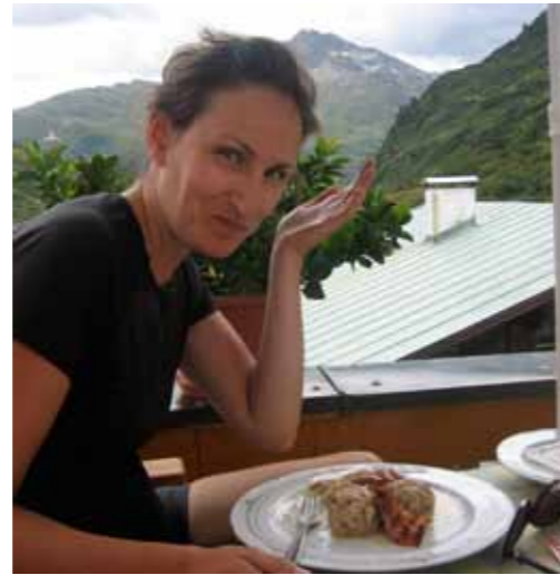
Klößen eten op de Arlbergpas

De Reschenpas was niet moeilijk, Nortbertshöhe die ervoor ligt is zes kilometer lang 7%. Een makkie. En dan sta je ineens in Italië!