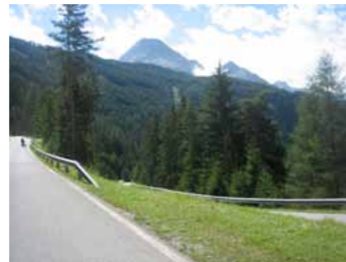
Nortbertshöhe; dat stipje zijn Raf en ik