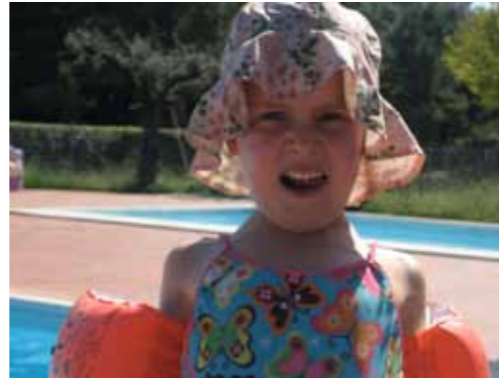
Op de vriendelijke camping van Stimigliano