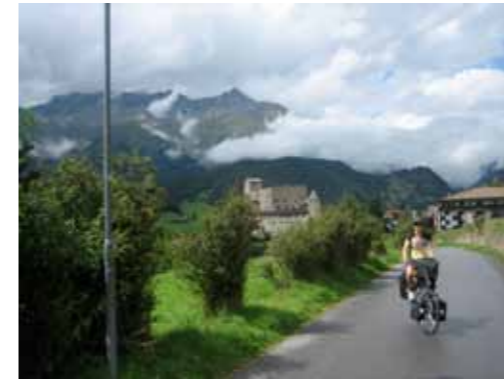
Het dal na Norbertshöhe, gerust in speeltuin onder kasteel