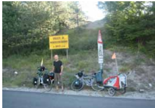
We hadden de pas 's ochtends vroeg gedaan, de kinderen sliepen nog