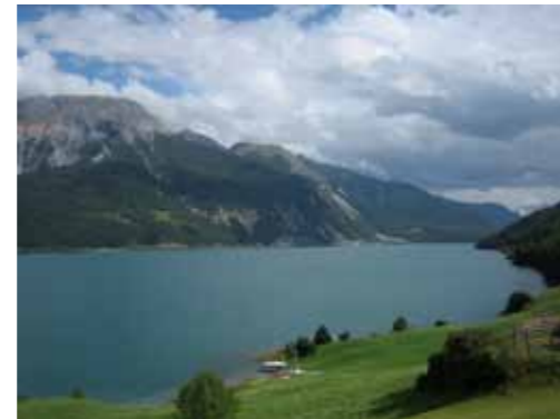
Na de Reschenpas gaat de route langs bergmeren