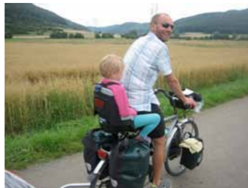
Rechts: Voorbij de beklimning van de Schwäbische Alb, richting Sigmaringen