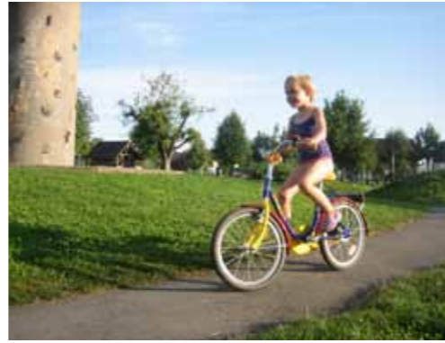
Op de rustdag in de speeltuin

We stonden er niet bij stil, maar we hadden al anderhalve week gefietst zonder rustdagen. Ik had geen geld uitgegeven aan een goede fietsbroek en daar had ik intussen - natuurlijk - spijt van. Op een fijne boerderijcamping met een zwembad hebben we een genoeglijk dagje rust gehad. Ik heb daar mijn broekjes vermaakt, kussentjes weggehaald waar ze te dik waren en teruggezet waar te weinig steun zat. We naderden de Alpen al en we lagen goed op koers. Op naar Noord-Italië en wie weet zelfs Florence. Rome??