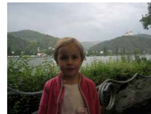
Tijdens een regenbui in het Rijndal verschijnt er een regenboog boven het kasteel. Echt iets voor ons prinsesje!