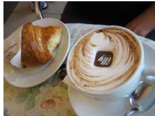
De lekkerste koffie van de vakantie