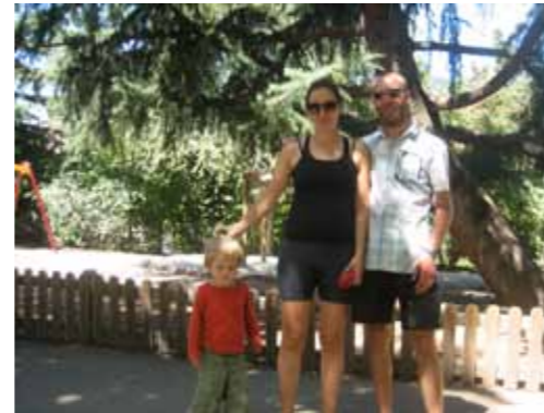
Speeltuin in Bolzano