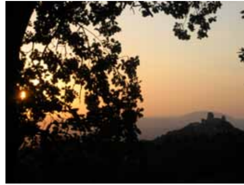
Uitzicht op Assisi vanuit de tent

Het was in Assisi dat we voor het eerst echt beseften hoe ver we eigenlijk al waren. Dat we Rome echt konden halen. Met gemak zelfs, we hadden ruim de tijd! De etappes waren steil en nog steeds vreselijk heet. Het was een van de langstdurende hittegolven in Italië ooit. Maar de etappes waren ook heel erg mooi en we genoten vooral van de stille ochtendschemeringen.