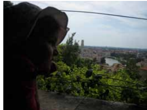
Uitzicht vanaf de camping