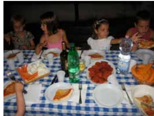
Diner in de tuin bij Patriccio