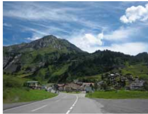
De Arlbergpas slingert tegen de berg omhoog