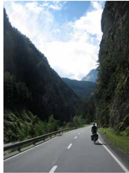
Een prachtig stukje door Zwitserland met super steile bergtoppen om je heen