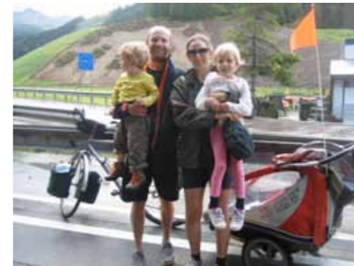
De grens naar Italië!