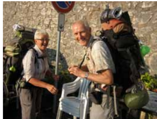
Deze mensen hadden de route in een paar maanden gewandeld. We hebben een avond met ze gegeten en kwamen ze daags later onderweg weer tegen