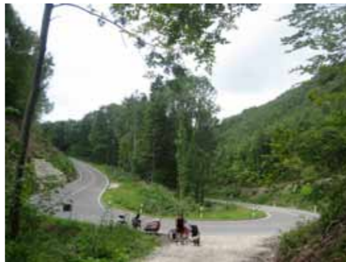
Pauzeplek op de Schwäbische Alb